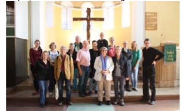
© Andreas Schubert Dank an Andreas Schubert für das Teilnehmer-Foto