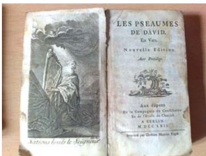
Titelkupfer zu Les Pseaumes de David, von Daniel Chodowiecki, 1759 Die Psalmen dAvids in Versen. Gedruckt Berlin 1762, von Chrétien Maurice Vogel, auf Kosen der Gesellschaft des Konsistoriums und der École de Charité (Schule der Barmherzigkeit)

Dokumente aus dem Pfarrarchiv. Seit 1689 wurde die Buchholzer Kirche von der evangelisch-lutherischen und der französisch-reformierten Gemeinde zur Feier ihrer Gottesdienste genutzt. Ein Edict von Friedrich Wilhelm, 1722, auf Französisch. Linke Seite: An unsere lieben und vielgeliebten Pastoren und Ältesten der Französischen Kirche in Buchholz. Rechte Seite: Friedrich Wilhelm von Gottes Gnaden, König von Preußen, Markgraf von Brandenburg, Erzkämmerer und Kurfürst des Heiligen römischen Reiches etc. etc. Ihr Lieben und Vielgeliebten! Wir teilen Ihnen mit dieser Kopie eines Schreibens an das Ob erste Französische Konsistorium den Beschluss über eine Sammlung mit, die wir gnädigerweise in unseren Staaten durchführen lassen, um ein Waisenhaus in Potsdam zu gründen für die Waisen der Soldaten Unserer Armee & ordnen an, diese vorliegende Order sofort durchzuführen in aller Ordnung und Form. Berlin, den 12. Januar 1722 (Errichtung des Großen Militärwaisenhauses Potsdam, heute: Breite Straße)