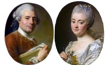
Alexander Roslin Porträt von Joseph-Marie Vien (1757) und der Malerin Marie Thérèse Rebout (1757), Ehefrau von J.-M. Vien.

Sein berühmtester Schüler wurde Jacques-Louis David.