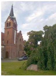
Pfarrer-Hurtienne-Platz, Hänge-Buche ( Fagus sylvatica Pendula), zur Jahrtausendwende von der Firma Märkisch Grün, Melchow gespendet. NGA Pankow

Das Landesdenkmalamt Berlin veranstaltete den diesjährigen Tag des Offenen Denkmals am Samstag, dem 12.9. und Sonntag, den 13.9.2015. Französisch Buchholz war zum ersten Mal dabei.