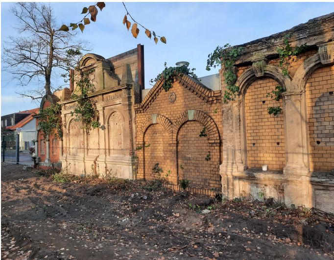
Reste der Erbbebräniswand nach dem Baustopp durch die BVV-Pankow vom 24.11.2020