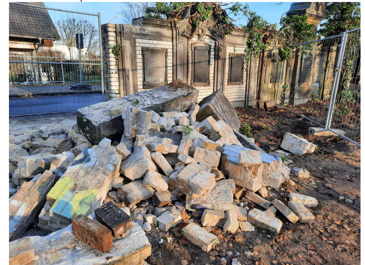
Reste der Erbbebräniswand nach dem Baustopp durch die BVV-Pankow vom 24.11.2020