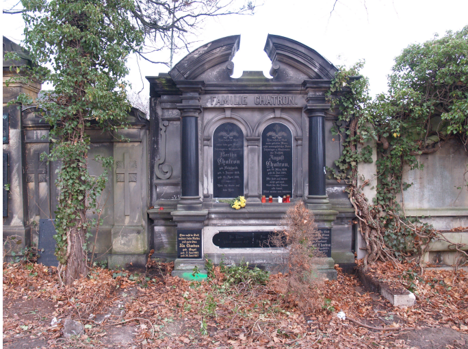
Das zerstörte Grab der Familie Chartron