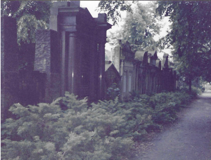
Erbbebränisallee Friedhof | IX | 1980 3. v.l. Erbbebränis Conradi