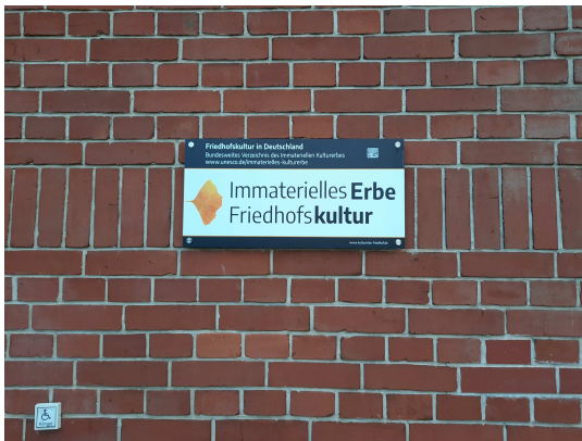
Amtsleitung Friedhofsverwaltung Pankow, Friedhof III